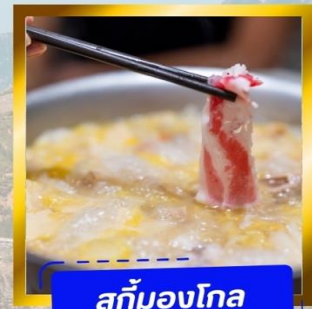
สุกั่มองโก