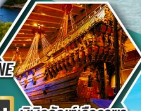
น้ำพุแห่ง ราชินีเคเฟออบ