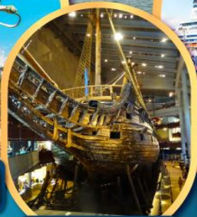
พิพิธภัณฑ์เรือวาซา