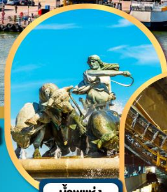
น้ำพุแห่งราชินีเกรฟฟอน