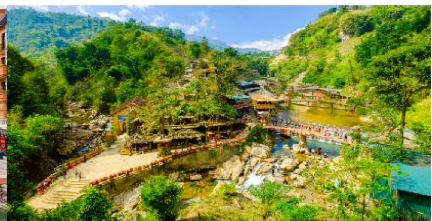
หมู่บ้านก๊อต ก๊อต

*ทางบริษัทฯ ขอสงวนสิทธิ์ในการสลับโปรแกรมทัวร์ตามความเหมาะสมขึ้นอยู่กับสถานการณ์ปัจจุบัน โดยคำนึงถึงผลประโยชน์ของลูกค้าเป็นสำคัญ