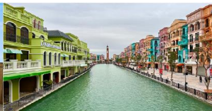
เมก้าแกรนด์เวิลด์ฮานอย