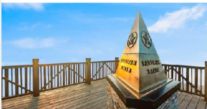
ยอดเขาฟานซิปิน