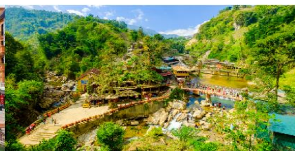
หมู่บ้านก๊อต ก๊อต

*ทางบริษัทฯ ขอสงวนสิทธิ์ในการสลับโปรแกรมทัวร์ตามความเหมาะสมขึ้นอยู่กับสถานการณ์ปัจจุบัน โดยคำนึงถึงผลประโยชน์ของลูกค้าเป็นสำคัญ