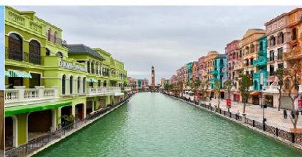
เมก้าแกรนด์เวิลด์ฮานอย