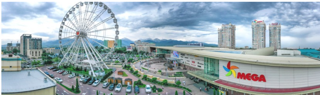
เที่ยว 2 สถานที่...กับความต่างที่ลงตัว...อุซเบกิสถาน-คาซัคสถาน 8 D6N by KC on Oct- Dec 2024

จากนั้นนำท่านสู่ Mega Park Mall ศูนย์การค้าขนาดใหญ่ที่มีร้านค้าแบรนด์ชื่อดังและแบรนด์ระดับโลกมากมายมีสินค้าและบริการเพื่อความบันเทิงหลากหลายทั้งสินค้าแฟชั่น อาทิ Zara, H&M, Stradivarius, Bershka, Pull & Bear, Guess, Crocs, Starbucks, Paul, อุปกรณ์กีฬา เครื่องใช้ ร้านอาหาร โรงภาพยนตร์ (เพื่อความสะดวกในการเลือกซื้อสินค้า อิสระรับประทานอาหารกลางวันในเมก้ามอลล์)