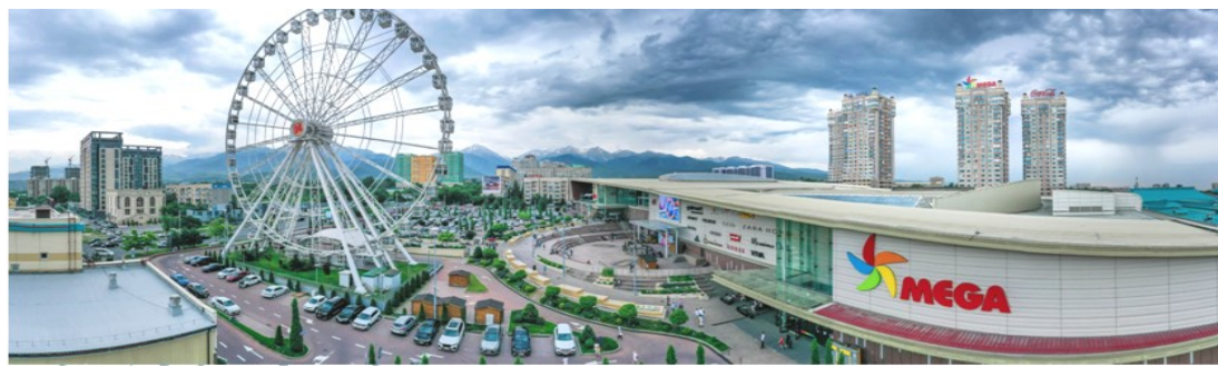
เที่ยว 2 สถานที่...กับความต่างที่ลงตัว...อุซเบกิสถาน-คาซัคสถาน 8 D6N by KC on Oct- Dec 2024

จากนั้นนำท่านสู่ Mega Park Mall ศูนย์การค้าขนาดใหญ่ที่มีร้านค้าแบรนด์ชื่อดังและแบรนด์ระดับโลกมากมายมีสินค้าและบริการเพื่อความบันเทิงหลากหลายทั้งสินค้าแฟชั่น อาทิ Zara, H&M, Stradivarius, Bershka, Pull & Bear, Guess, Crocs, Starbucks, Paul, อุปกรณ์กีฬา เครื่องใช้ ร้านอาหาร โรงภาพยนตร์ (เพื่อความสะดวกในการเลือกซื้อสินค้า อิสระรับประทานอาหารกลางวันในเมก้ามอลล์)