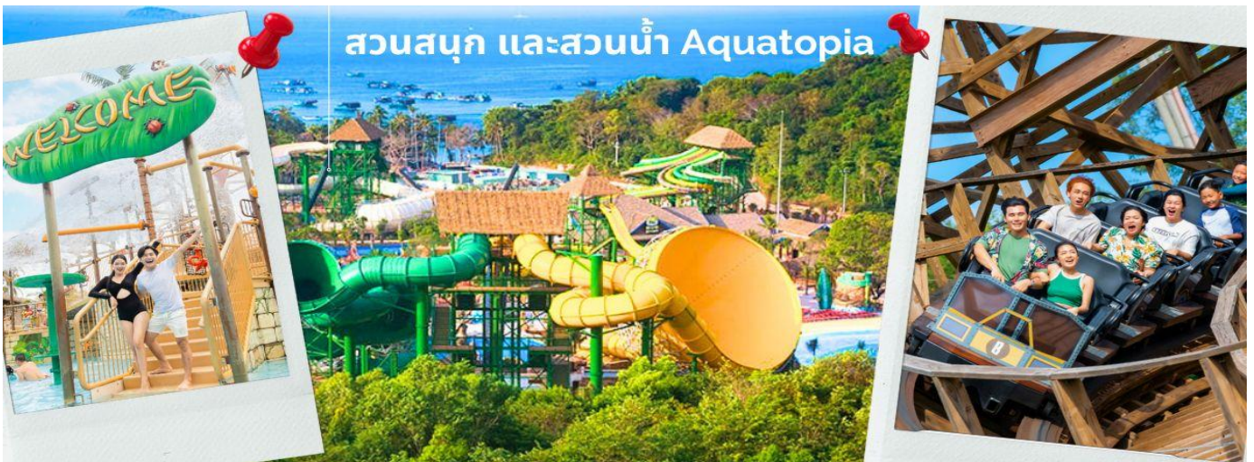
สวนสนุก และสวนน้ำ Aquatopia

จากนั้นนำท่าน ชมสวนน้ำ และสวนสนุก Aquatopia Park ที่ตั้งอยู่บนเกาะฮอนเทิม (Hon Thom) ประกอบไปด้วยสวนน้ำขนาดใหญ่ และเครื่องเล่นมากมายให้ท่านได้เลือกเล่นได้ตามใจชอบ สวนน้ำ Aquatopia ตั้งอยู่ทางตอนใต้ของเกาะฟูโก๊วก ถือเป็นสวนน้ำที่ใหญ่ที่สุดในเอเชียตะวันออกเฉียงใต้ที่มีเครื่องเล่นที่ทันสมัยมากกว่า 20 ชนิด นอกจากโซนสวนน้ำที่เหมาะสมสำหรับครอบครัวแล้ว Aquatopia Park ยังมีเครื่องเล่นที่น่าตื่นเต้นอีกมากมายให้ท่านได้เลือกเฟลิตเฟลิน รวมไปถึงร้านค้าจำหน่ายของฝาก และร้านอาหารมากมายให้เลือกร้านอาหาร ระหว่างเดินเที่ยวในสวนสนุกแห่งนี้