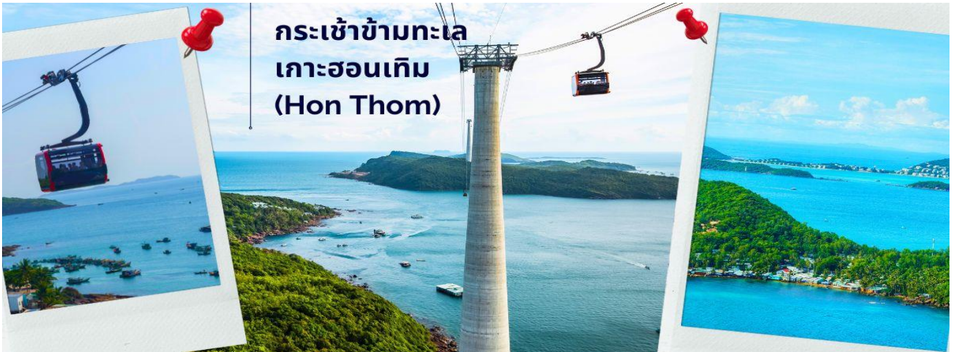
กระเช้าข้ามทะเล เกาะฮอนเทิม (Hon Thom)

นำท่านนั่ง กระเช้าข้ามทะเล Hon Thom Cable Car บรรยากาศสุดตื่นเต้นประทับใจ กับความสูงของกระเช้าและยังทอดยาวข้ามทะเลเมื่องสู่เกาะ ฮอนเทิม (Hon Thom) เกาะที่ได้ชื่อว่าเป็นเกาะแห่งการพักผ่อนอย่างแท้จริง โดยกระเช้าแห่งนี้ได้รับการขนานนามว่า เป็นกระเช้าข้ามทะเลที่ยาวที่สุดในโลกอันดับสาม โดยมีระยะทางยาว 7,899.9 เมตร อยู่ทางฝั่งทะเลใต้ของหมู่เกาะฟูโก๊วก ตัวกระเช้าขนาดใหญ่ สามารถรองรับผู้โดยสารได้มากถึง 30 คน เคลื่อนตัวด้วยความเร็วสูงสุด 8.5 เมตร/วินาที โดยใช้เวลาประมาณ 15 นาที