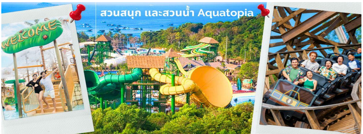
สวนสนุก และสวนน้ำ Aquatopia

จากนั้นนำท่าน ชมสวนน้ำ และสวนสนุก Aquatopia Park ที่ตั้งอยู่บนเกาะฮอนเทิม (Hon Thom) ประกอบด้วยสวนน้ำขนาดใหญ่ และเครื่องเล่นมากมายให้ท่านได้เลือกเล่นได้ตามใจชอบ สวนน้ำ Aquatopia ตั้งอยู่ทางตอนใต้ของเกาะฟูโก๊วก ถือเป็นสวนน้ำที่ใหญ่ที่สุดในเอเชียตะวันออกเฉียงใต้ที่มีเครื่องเล่นที่ทันสมัยมากกว่า 20 ชนิด นอกจากโซนสวนน้ำที่เหมาะสมสำหรับครอบครัวแล้ว Aquatopia Park ยังมีเครื่องเล่นที่น่าตื่นเต้นอีกมากมายให้ท่านได้เลือกเพลิดเพลิน รวมไปถึงร้านค้าจำหน่ายของฝาก และร้านอาหารมากมายให้เลือกซื้อทาน ระหว่างเดินเที่ยวในสวนสนุกแห่งนี้