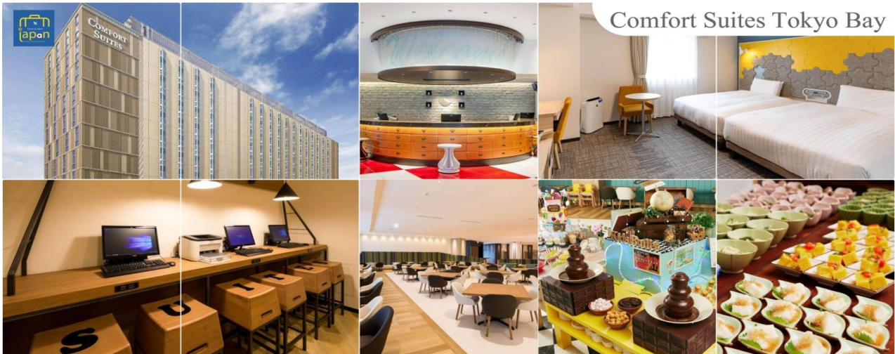
Comfort Suites Tokyo Bay

เย็น อีسرรับประทานอาหารเย็นตามอัธยาศัย พักที่ COMFORT SUITES TOKYO BAY หรือเทียบเท่าระดับเดียวกัน