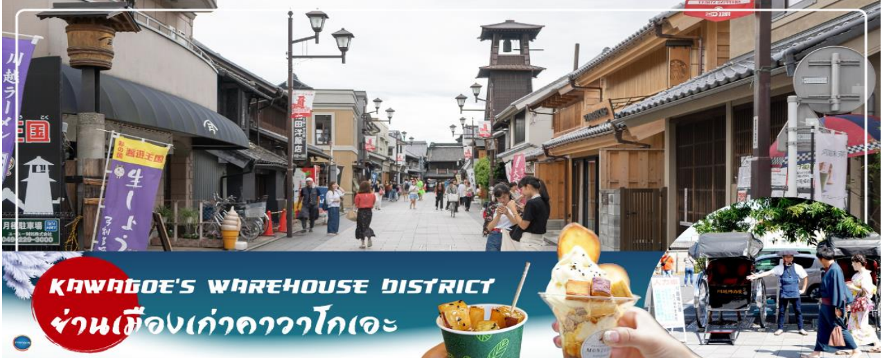
KAWAGOE'S WAREHOUSE DISTRICT ย่านเมืองเก่าคาวาโกเอะ

เป็นเส้นช้อปปิ้ง ที่ร้านค้าส่วนใหญ่จะขายขนมพื้นเมืองเช่น เค้ก และ ขนมหวาน จึงเป็นที่มาของชื่อ ดรอกลูกกวาดหรือดรอกขนมนั่นเอง นอกจากนี้ยังมีขายคารินโดะ (karinto) คุกกี้พื้นเมืองญี่ปุ่น, ไอศกรีม, ขนมที่ทำจากถั่วแดงและมันหวาน และยังมีของเล็กชิ้นเล็กๆและของฝากต่างๆ จนกระทั่งได้ เวลาอันสมควรนำท่านเดินทางสู่ จังหวัดกุนมะ (Gunma) (ใช้เวลาเดินทางประมาณ 2 ชั่วโมง) จังหวัดเล็กใกล้โตเกียว เป็นแหล่งออนเซ็นที่เลื่องลือในเรื่องของคุณภาพน้ำพุร้อนและมีทิวทัศน์สวยงามน่าประทับใจ ซึ่งครองใจชาวญี่ปุ่นและนักท่องเที่ยวมายาวนาน