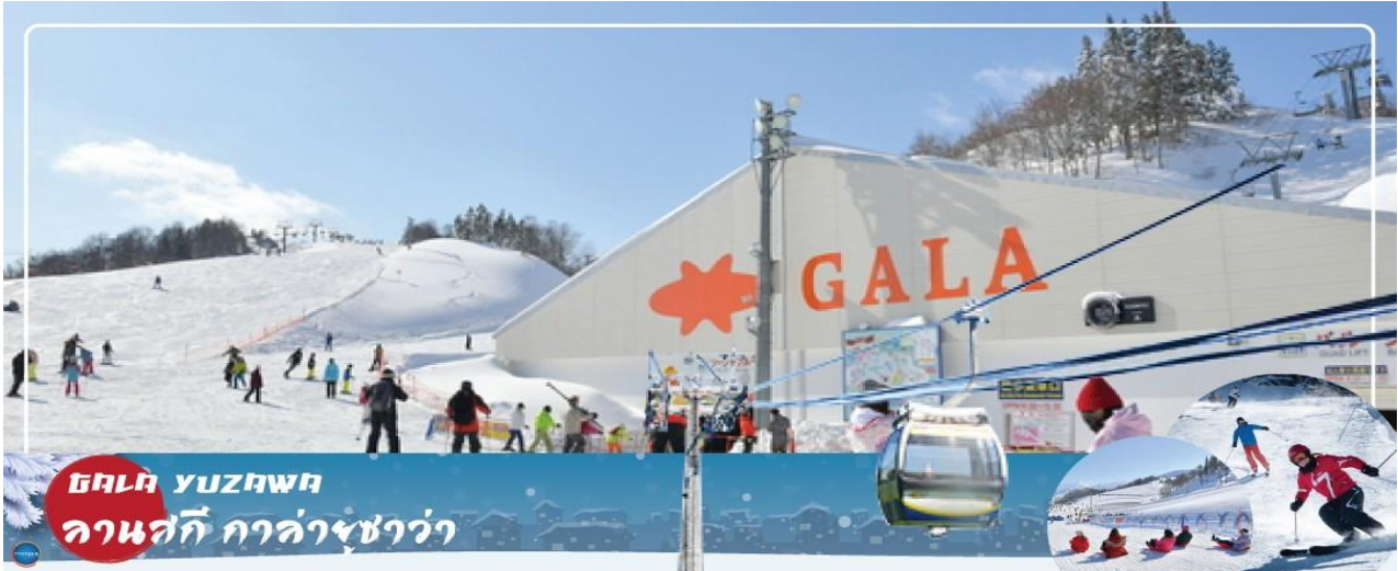
สถาน YUZAWA ลานสกี กาล่ายูซาว่า

วันที่สี่ เมืองกุนมะ – จังหวัดนิงาตะ – ลานสกี กาล่ายูซาว่า (GALA YUZAWA) – วัดโชรินซัง ดารุมะจิ – กรุงโตเกียว – ย่านโอไดบะ – ห้างไดเวอร์ซิตี