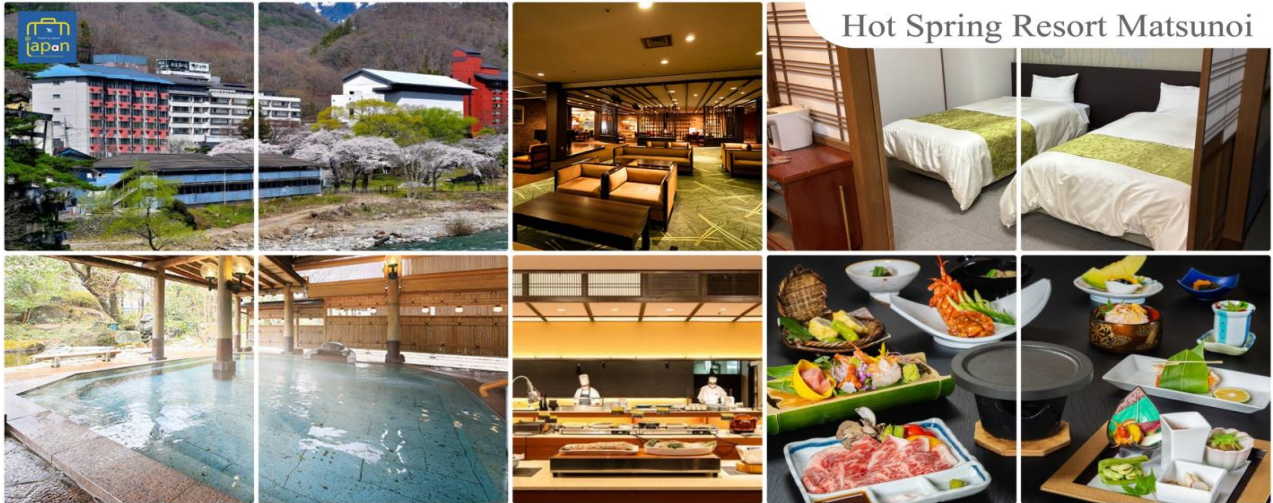
Hot Spring Resort Matsunoi

รับประทานอาหารค่ำ ณ ภัตตาคาร ของโรงแรม (5) --- บุฟเฟต์นานาชาติ หลังอาหารให้ท่านได้ผ่อนคลายกับการแช่น้ำแร่ธรรมชาติ เชื่อว่าถ้าได้แช่น้ำแร่แล้ว จะทำให้ ผิวพรรณสวยงามและช่วยให้ระบบหมุนเวียนโลหิตดีขึ้น