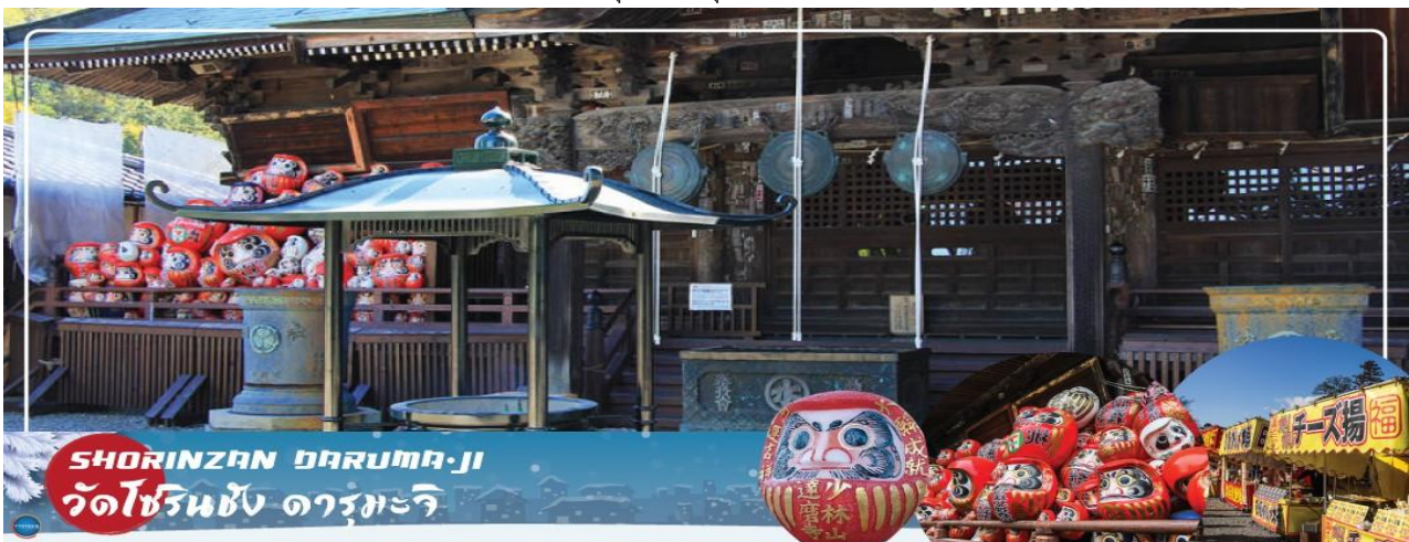
SHORINZAN DARUMA-JI วัดโชรินซัง ดารุมะจิ

จากนั้นนำท่านเดินทางสู่เมือง ทาคาซากิ เพื่อเยี่ยมชม วัดโชรินซัง ดารุมะจิ (SHORINZAN DARUMA-JI) (ใช้เวลาเดินทางประมาณ 2 ชั่วโมง) วัดนี้สร้างขึ้นในปี 1697 และกล่าวกันว่าเป็นสถานที่ต้นกำเนิดตุ๊กตาดารุมะของญี่ปุ่น ตุ๊กตามีขนาดครายอดนิยมนี้เป็นเครื่องรางนำโชค ตามธรรมเนียมแล้ว เมื่อท่านต้องการขอพรให้เต็มดวงตาข้างหนึ่งของตุ๊กตา และเมื่อพรที่ขอไว้เป็นจริง ค่อยเติมตาอีกข้างหนึ่ง แล้วพอถึงช่วงสิ้นปี ก็ให้นำตุ๊กตาดังกล่าวมาเผาที่นี้ วัดแห่งนี้เต็มไปด้วยตุ๊กตาดารุมะที่มีขนาดและสีสันหลากหลาย ซึ่งแต่ละที่ก็สื่อถึงความหมายแตกต่างกัน สีแดงเป็นสีที่พบบ่อยที่สุด และเป็นสีสำหรับนำโชคลาภ โดยตุ๊กตาดารุมะที่นี้จะมีให้เราเลือกหลายสี หลายขนาดและราคา