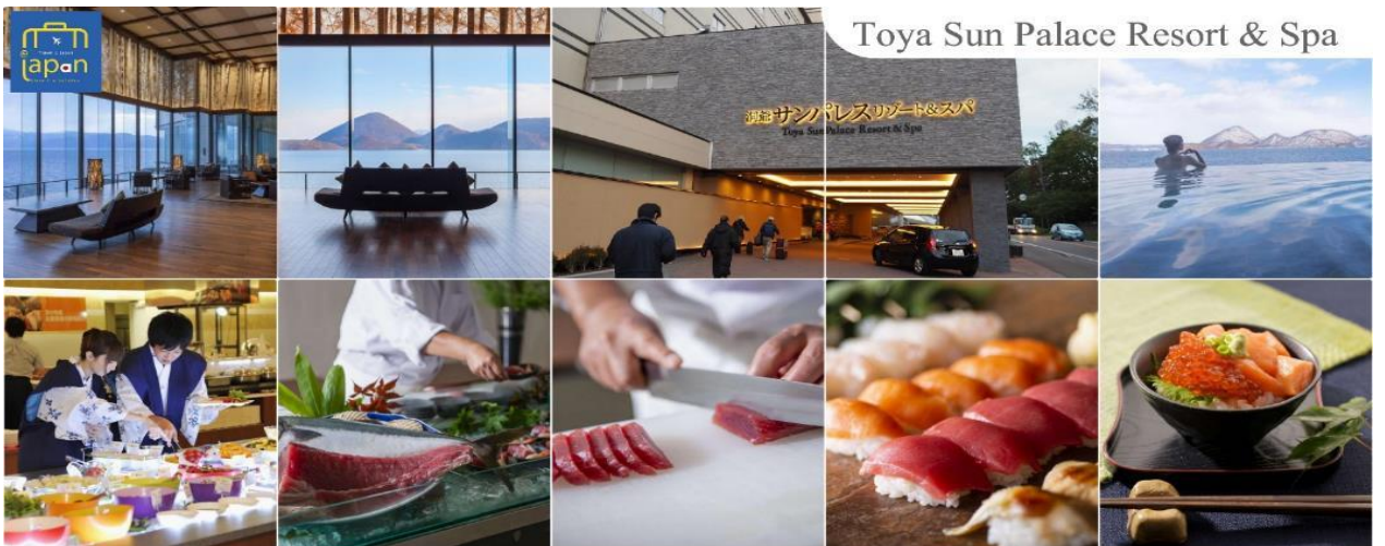
Toya Sun Palace Resort & Spa

ที่พัก TOYA SUN PALACE RESORT & SPA หรือเทียบเท่าระดับเดียวกัน