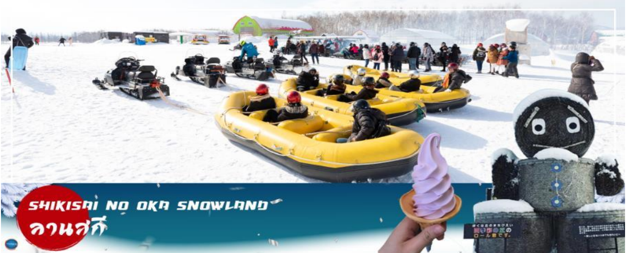
SHIKISAI NO OKA SNOWLAND ลานสกี

เมืองอาซาฮิดะว่า – เมืองฟูราโนะ – ลานสโนว์ เวิลด์ (กิจกรรมทางหิมะ) – หมู่บ้านเทพนิยาย นิงเกิ้ลเทอเรส – เมืองซัปโปโร – ถนนช้อปปิ้งทานุกิโจจิ