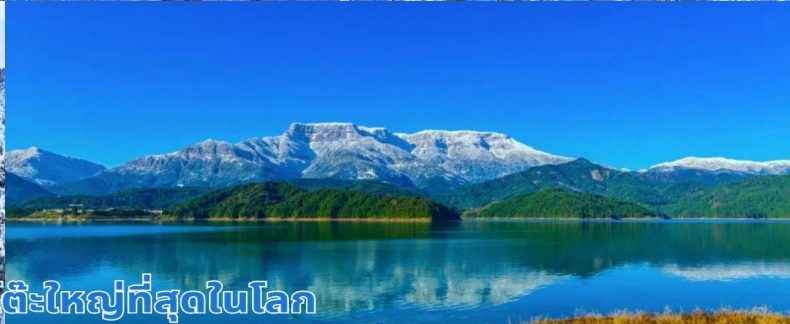
ภูเขาหิมะวาวู ภูเขาโต๊ะใหญ่ที่สุดในโลก