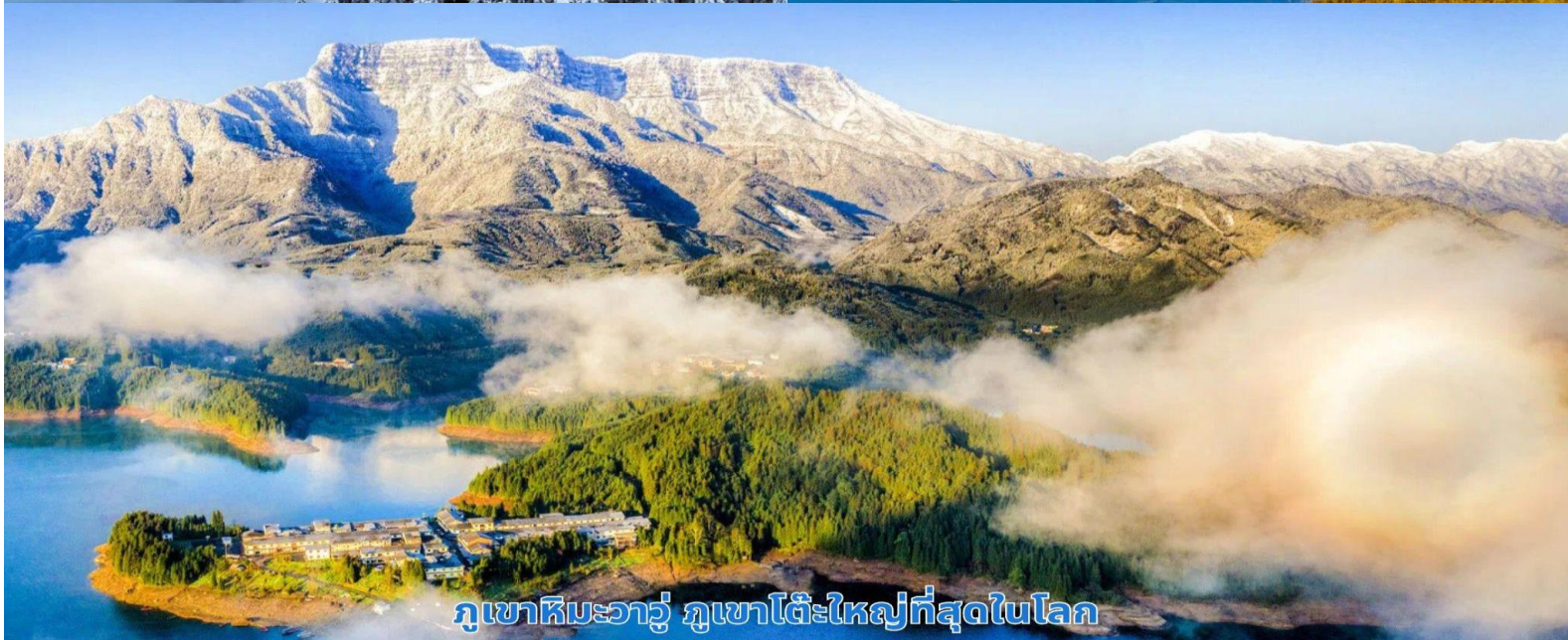
ภูเขาหิมะวาวู ภูเขาโต๊ะใหญ่ที่สุดในโลก