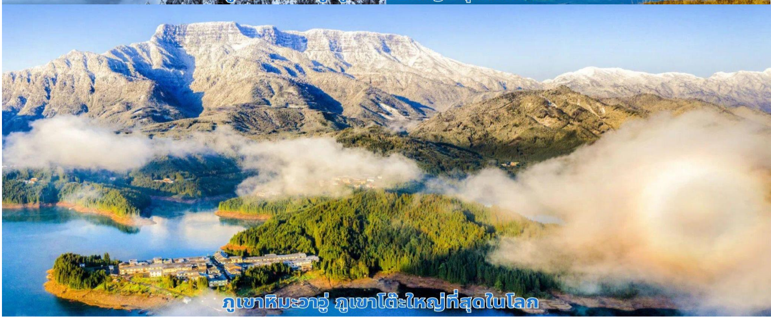
ภูเขาหิมะวาวู ภูเขาโต๊ะใหญ่ที่สุดในโลก