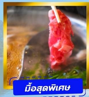
มือสุตพิเศษ