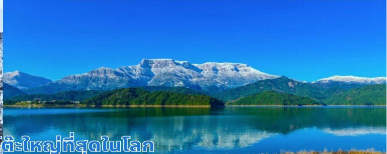
ภูเขาหิมะวาวู ภูเขาโต๊ะใหญ่ที่สุดในโลก