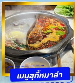
เมนูสุกี้หม่าล่า