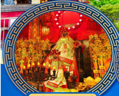
วัดเจ้าแม่กวนอิมฮองอำ