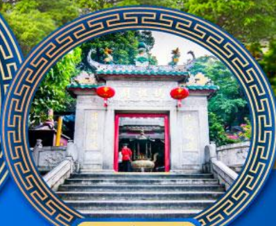
วัดอาม่า มาเก๊า