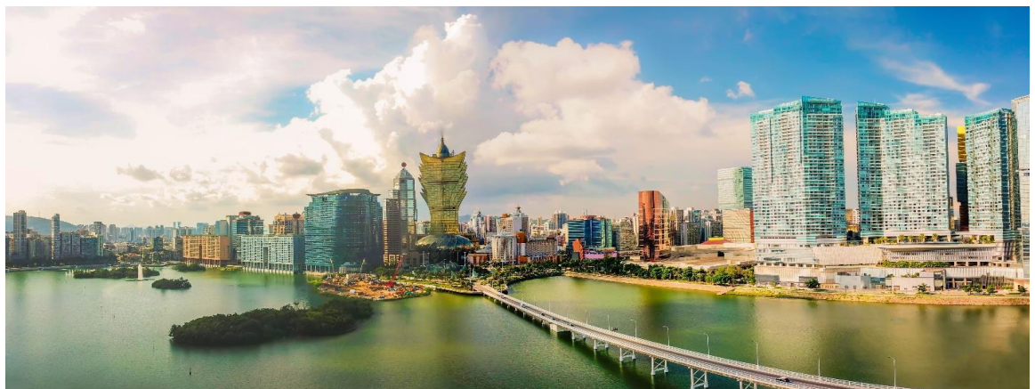
GO1MFM-NX007 มาเก๊า อ่องกง ไห่พระ นังกระเช้าอองปิง เวเนเซียน 4 วัน 3 คืน โดยสายการบิน Air Macau (NX) พัก 5 คืน

21.50 น. เดินทางถึง สนามบินสุวรรณภูมิ โดยสวัสดิภาพ พร้อมความประทับใจ