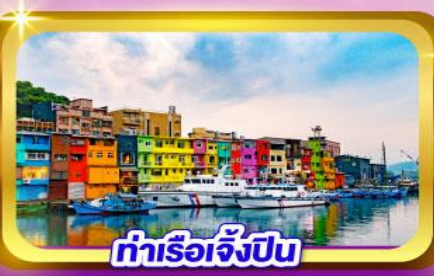
ท่าเรือเจิ้งปิน