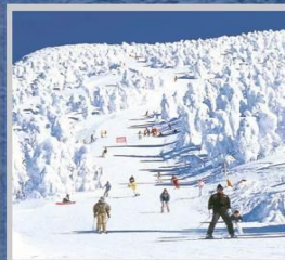
"ZAO SKI RESORT"