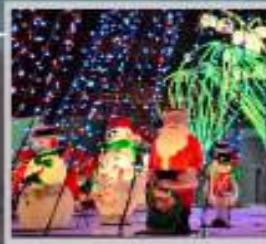
"ODORI GERMAN CHRISTMAS"