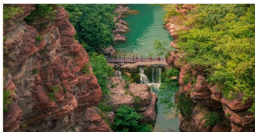
อุทยานสวรรค์หยุนโตซาน