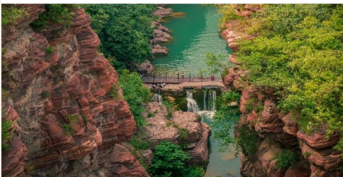
อุทยานสวรรค์หยุนโถซาน