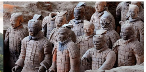
สุสานทหารจีนซี

*ทางบริษัทฯ ขอสงวนสิทธิ์ในการสลับโปรแกรมทัวร์ตามความเหมาะสมขึ้นอยู่กับสถานการณ์หน้างาน โดยคำนึงถึงผลประโยชน์ของลูกค้าเป็นสำคัญ