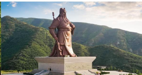
บ้านเกิดท่านกวนอู