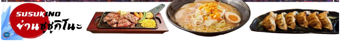
SUSUKINO ย่านซุซุกิโนะ