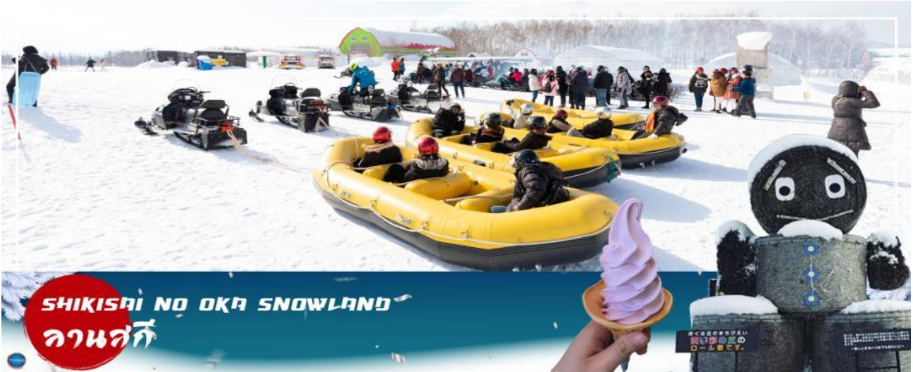
SHIKISAI NO OKA SNOWLAND ลานสกี

ลงจากเนินตามเนินเขาที่กำหนด และยังมี Banana Boat ที่ลากด้วยสโนว์โมบิลที่ลากซิกแซกตามสันเนินสร้างความสนุกสนานตื่นเต้นได้มากเลยทีเดียว และ Sled สำหรับพาหewanส่วนตัว ที่ไหลลงจากเนินสูง (**หมายเหตุ ราคาไปรวมค่าเล่นกิจกรรมต่างๆ ค่าเช่าชุดและอุปกรณ์ กรณีลานสโนว์เวลดปิด บริษัทสงวนสิทธิ์ นำลูกค้าไปลานสโนว์เวลดอื่นแทนได้ตามความเหมาะสมกับสถานการณ์)