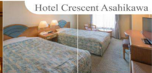
Hotel Crescent Asahikawa