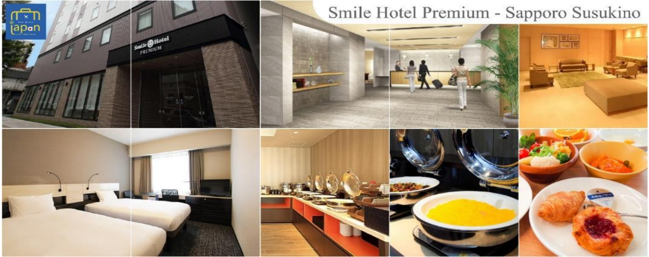
Smile Hotel Premium - Sapporo Susukino

รับประทานอาหารเย็น ณ ภัตตาคาร (3) พิเศษ!!! เมนู นูฟเฟต์ซามู + ซามู SMILE HOTEL PREMIUM - SAPPORO SUSUKINO หรือเทียบเท่าระดับเดียวกัน