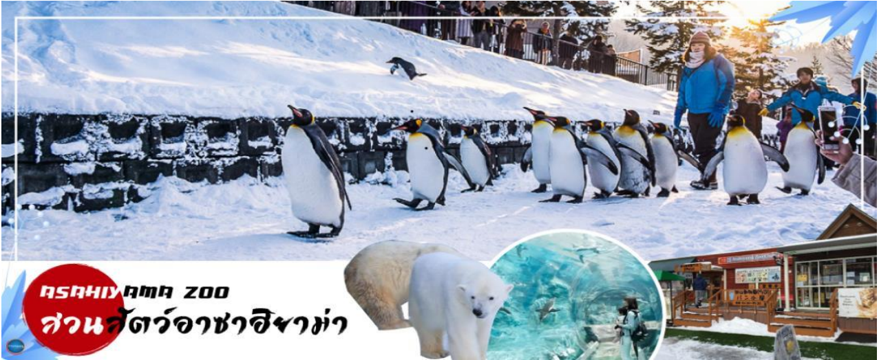
ASAHIYAMA ZOO สวนสัตว์อาซาฮิยาม่า

วันที่สาม เมืองอาซาฮิคาว่า – สวนสัตว์อะซาฮิยาม่า – หมู่บ้านรามะอะซาฮิยาม่า – เมืองฟูราโน – ลานสโนว์ เวิลด์ (กิจกรรมทางหิมะ) – เมืองซัปโปโร – ย่านซูซุกิโนะ