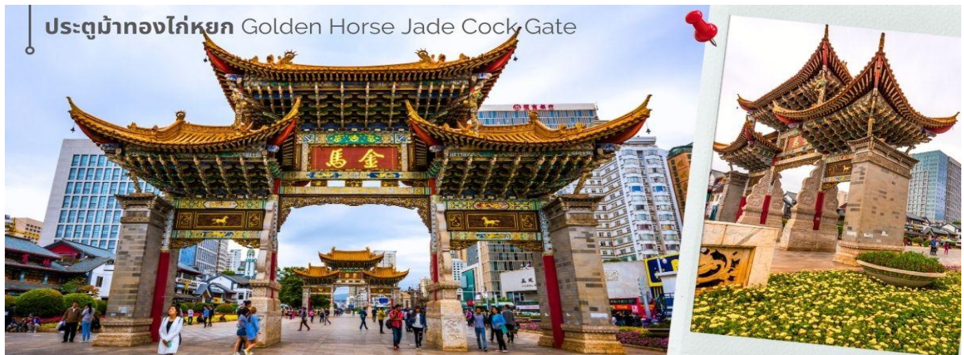
ประตูม้าทองไก่หยก Golden Horse Jade Cock Gate

ชม ซุ้มประตูม้าทอง และ ซุ้มประตูไก่หยก ซึ่งภาษาจีนเรียกว่าจินหม่า และปี้จี้ จิ้งเออคำย่อ จีนปี้ มาชานาน นามถนนแห่งนี้ ซุ้มม้าทองและไก่หยก มีอายุร่วม 400 ปี สร้างขึ้นในสมัยราชวงศ์หมิง ในถนนย่านการค้าแห่งนี้ เป็นแหล่งเสื้อผ้าแบรนด์เนมทั้งของจีนและต่างประเทศ รวมทั้งเครื่องประดับ อัญมณี ร้านเครื่องดื่ม และร้านขายของที่ระลึกมากมาย