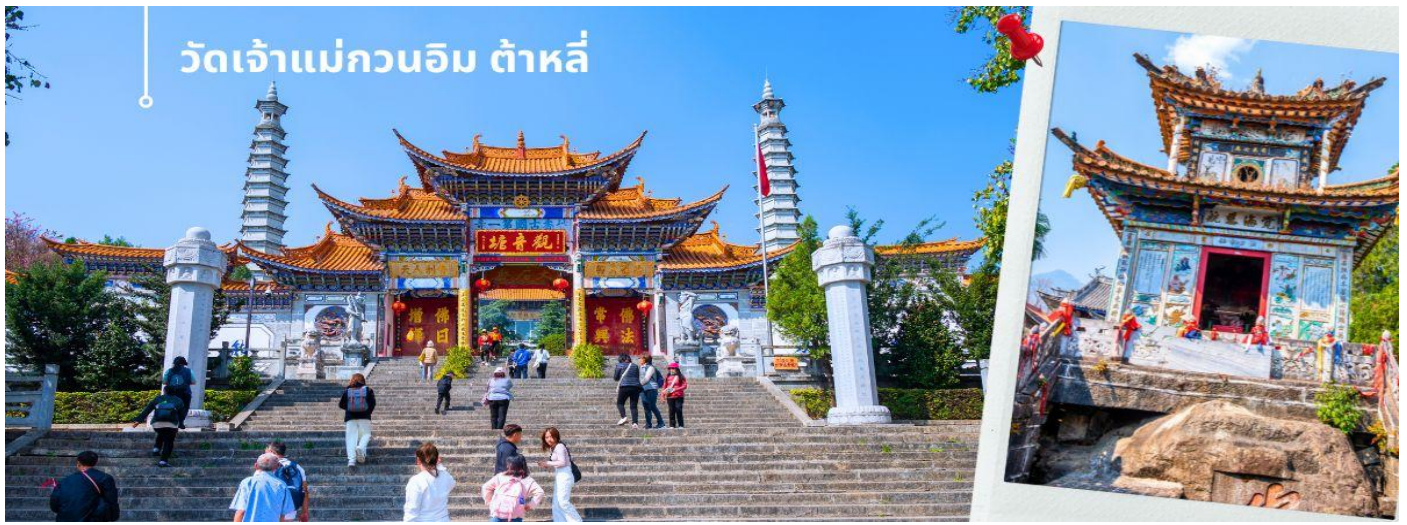
วัดเจ้าแม่กวนอิม ต้าหลี่

เช้า 📍 รับประทานอาหารเช้า ณ ห้องอาหารโรงแรม (4) นำท่านชม วัดเจ้าแม่กวนอิม (ใช้เวลาเดินทาง 30 นาที) ตามตำนานเล่าว่าเจ้าแม่กวนอิมได้แปลงกายเป็นหญิงชราแบกก้อนหินใหญ่ไว้บนหลังเพื่อให้ทหารของฝ่ายตรงข้ามได้เห็นเมื่อทหารฝ่ายศัตรูได้เห็นว่ามีแม่แต่หญิงชรายังแข็งแรงถึงเพียงนี้ ถ้าเป็นคนวัยหนุ่มสาวจะต้องมีพลังกำลังมากมายยากที่จะต่อสู้อ จึงทำให้ไม่ทำการเข้าโจมตีเมืองและถอยทัพกลับไป ชาวเมืองจึงสร้างวัดแห่งนี้ขึ้นในสมัยราชวงศ์ถัง ซึ่งถือว่าเป็นวัดที่มีประติมากรรมยอดเยี่ยมแห่งหนึ่งในต้าหลี่