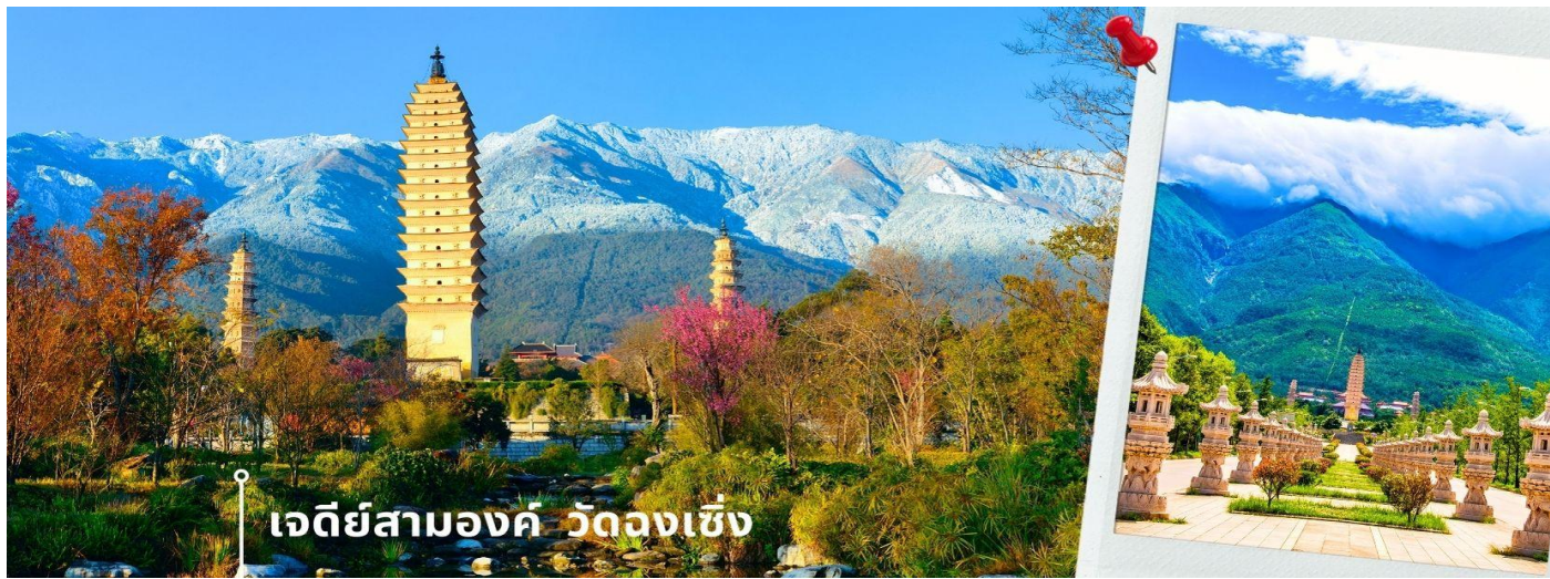
เจดีย์สามองค์ วัดจงเซ็ง

จากนั้นผ่านชม เจดีย์สามองค์ สัญลักษณ์ของเมืองต้าหลี่ ตั้งอยู่ภายใน วัดจงเซ็ง (Chongsheng Temple) วัดเก่าแก่ที่สร้างขึ้นเมื่อศตวรรษที่ 9 นับว่าเป็นหนึ่งในเจดีย์ที่สูงที่สุดในประเทศจีน อีกทั้งยังมีความศักดิ์สิทธิ์เป็นอย่างมาก ว่ากันว่าเป็นหนึ่งในสิ่งก่อสร้างเพียงไม่กี่แห่งที่ไม่ถูกทำลายจากเหตุการณ์แผ่นดินไหวในเมืองต้าหลี่เมื่อปี ค.ศ. 1925 จึงกลายเป็นสถานที่เคารพศรัทธาของชาวต้าหลี่เป็นอย่างมาก