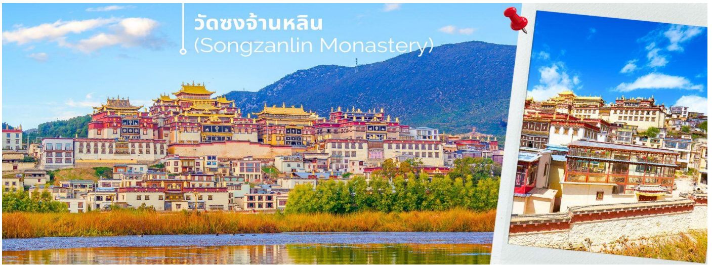
วัดชงจ้านหลิน (Songzanlin Monastery)

นำท่านชม วัดชงจ้านหลิน เป็นวัดลามะที่ใหญ่ที่สุดของมณฑล ยูนนานทางภาคตะวันตกเฉียงใต้ของจีน ถูกสร้างขึ้นในปีค.ศ.1679 อยู่ห่างจากตัวเมืองแซกกรี่ล่า 5 กิโลเมตร วัดนี้เป็นอีกหนึ่งสถานที่ท่องเที่ยวสำคัญของเมืองแซกกรี่ล่า ประเทศจีน ถ้ามาเที่ยวแซกกรี่ล่าแล้วไม่ได้แวะมาวัดชงจ้านหลินก็ถือว่ายังไม่ถึงแซกกรี่ล่า ด้านนอกวัดสามารถถ่ายรูปได้ แต่ภายในอาคารวัดห้ามถ่ายรูป