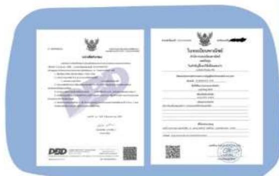
ตัวอย่างหนังสือจดทะเบียนบริษัท และ ใบทะเบียนพาณิชย์