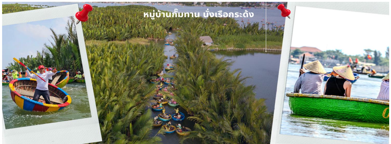
หมู่บ้านกิมทาน นั่งเรือกระดิง

จากนั้นนำท่านผ่านชม ภูเขาหินอ่อน Marble Mountains และนำท่านเข้าชม หมู่บ้านแกะสลักหินอ่อน ที่มีแหล่งวัตถุหินอ่อนเนื้อดี และช่างแกะสลักฝีมือประณีต ส่งออกจำหน่าย ทั่วโลก นำท่านเดินทางสู่ หมู่บ้านกิมทาน สนุกสนานไปกับการเล่นกิจกรรม นั่งเรือกระดิง เป็นหมู่บ้านเล็กๆในเมืองฮอยอันตั้งอยู่ในสวนมะพร้าวริมแม่น้ำ ในอดีตช่วงสงครามที่นี่เป็นที่พักอาศัยของเหล่าทหาร อาชีพหลักของคนที่นี่คืออาชีพ