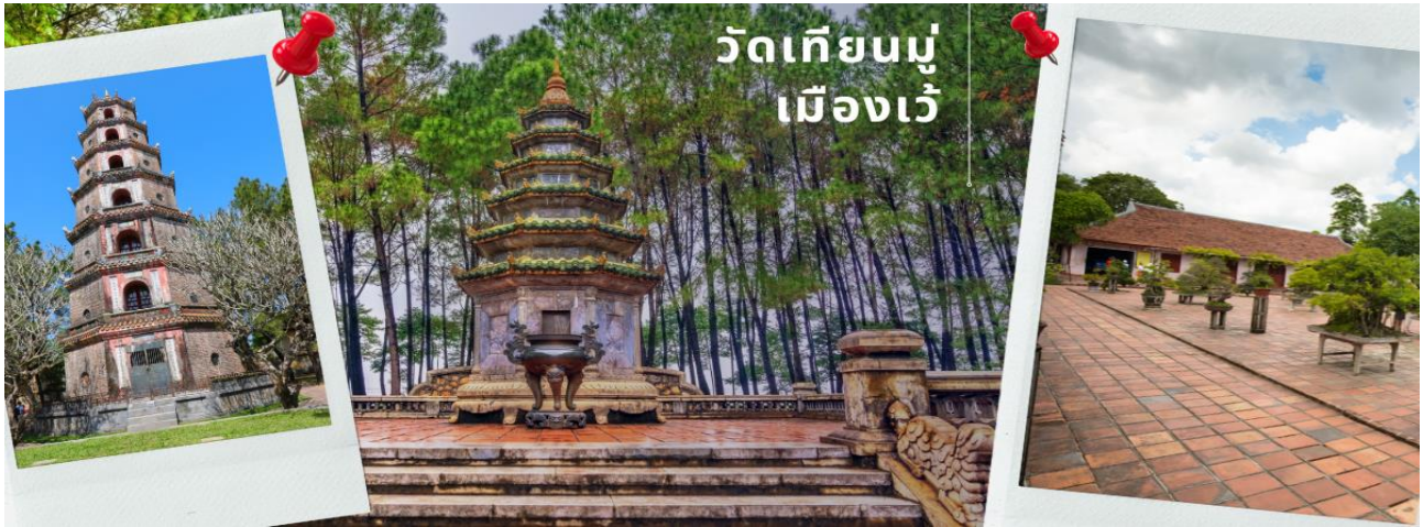
วัดเทียนมู่ เมืองเว้

บ่าย จากนั้นนำท่านเดินทางสู่เมืองเว้ (ใช้เวลาเดินทางประมาณ 2 ชม) นำท่านผ่านชม Tam Giang เป็นทะเลสาบน้ำกร่อยที่ใหญ่ที่สุดในเอเชียเป็นพื้นที่ชาวเวียดนามใช้ในการเลี้ยงกุ้ง ปลา เป็นจำนวนมาก และชมวิวที่สวยงามของอ่าวทะเล Lang Co เป็นหนึ่งในสิบอ่าวสวยงามที่สุดในโลกเป็นพื้นที่ชาวเวียดนามใช้ในการเลี้ยงหอยเพื่อการผลิตมุก จากนั้น นำท่านเข้าสู่ วัดเทียนมู่ ไหว้พระขอพรเจดีย์เทียนมู่ มีหอคอยเจดีย์ 8 เหลี่ยม สูง 8 ชั้น ซึ่งตั้งอยู่บนฝั่งซ้ายของแม่น้ำหอม พร้อมเรื่องเล่ามากมายเกี่ยวกับพระพุทธรักษา ณ.ที่แห่งนี้ ยังเป็นที่เก็บรอยอดีตหินสีฟ้าค้นประวัติศาสตร์ที่โลกต้องจารึกเนื่องมาจากมีพระจีนขับรอยอดีตค้นประวัติศาสตร์ที่ซ่อนอยู่ที่วัดนี้ไปราดน้ำมันเผาตัวเองประท้วงรัฐบาลเวียดนามที่ทำลายพระพุทธรักษา และเก็บภาพแห่งความประทับใจริมแม่น้ำหอม