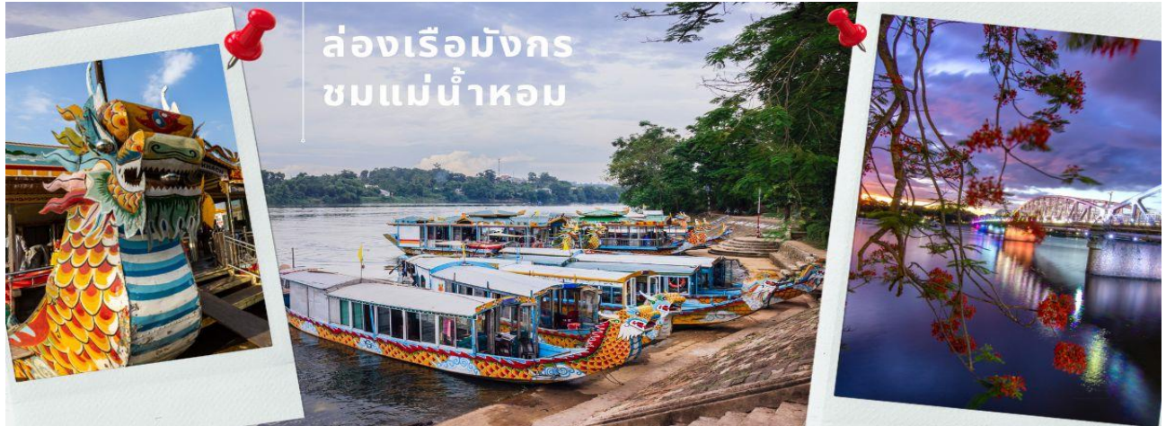
ล่องเรือมังกร ชมแม่น้ำหอม

จากนั้นนำท่าน ล่องเรือมังกรชมแม่น้ำหอม ชมการแสดงพื้นเมืองของชาวเวียดนามโบราณ ทั้งเสียงดนตรีที่มาจากเครื่องดนตรีดีดสี่ตีเป่า และเสียงร้องขับขานในเพลงเวียดนามดั้งเดิม มันก็จะเป็นอะไรที่ถือเป็นประสบการณ์ที่ไม่รู้ลืม