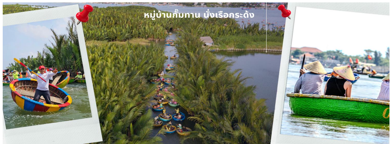
หมู่บ้านกิมทาน นั่งเรือกระดิง

จากนั้นนำท่านผ่านชม ภูเขาหินอ่อน Marble Mountains และนำท่านเข้าชม หมู่บ้านแกะสลักหินอ่อน ที่มีแหล่งวัตถุหินอ่อนเนื้อดี และช่างแกะสลักฝีมือประณีต ส่งออกจำหน่าย ทั่วโลก นำท่านเดินทางสู่ หมู่บ้านกิมทาน สนุกสนานไปกับการเล่นกิจกรรม นั่งเรือกระดิง เป็นหมู่บ้านเล็กๆในเมืองฮอยอันตั้งอยู่ในสวนมะพร้าวริมแม่น้ำ ในอดีตช่วงสงครามที่นี่เป็นที่พักอาศัยของเหล่าทหาร อาชีพหลักของคนที่นี่คืออาชีพ