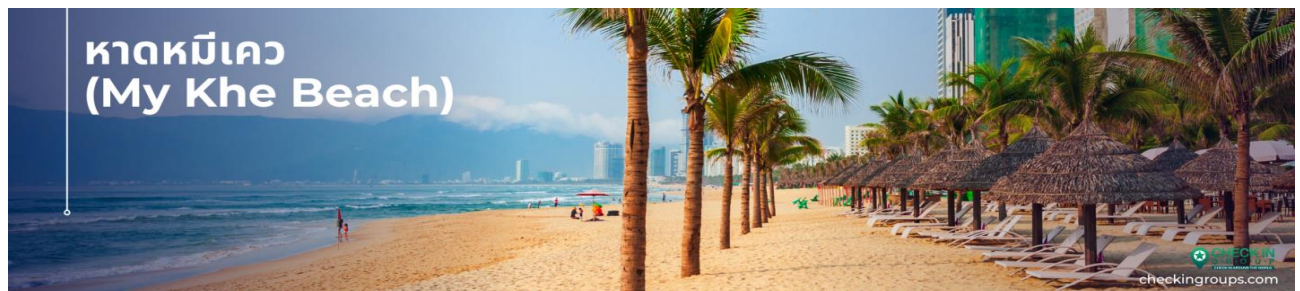
หาดหมีเคว (My Khe Beach)

นำท่านถ่ายรูปกับ หาดหมีเคว (My Khe Beach) ซึ่งเป็นหาดที่สวยงามที่สุดของดาหนังก็ว่าได้ หาดหมีเควมี่แนวชายหาดกว้างขวาง และมีความยาวถึง 10 กิโลเมตร ทรายที่นี้ชาวละเอียด เดินแล้วนุ่มเท้ามากๆ มีแนวแก้อัชชายหาดที่หลังคามุงด้วยจากตั้งเรียงรายสามารถนอน