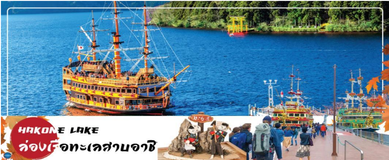
HAKONE LAKE ล่องเรือทะเลสาบอาชิ

วันที่สอง เมืองนาริตะ – เมืองฮาโกเนะ – ล่องเรือโจรสลัด – ถ่ายรูป โทริอิ สีแดงริมทะเลสาบฮาโกเนะ ณ ศาลเจ้าฮาโกเนะ – หุบเขาโอวาคุดานิ – จังหวัดยามานาชิ – หมู่บ้านโอชิโนะซัคเคิออนเซ็น + ขาบุญยักษ์