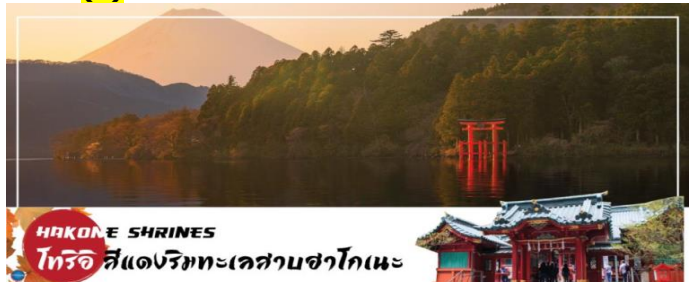
HAKONE SHRINES โทริอิ สีแดงริมทะเลสาบฮาโกเนะ

นำท่าน ชมวิวทะเลสาบ ณ ศาลเจ้าฮาโกเนะ (Hakone Shrines) ศาลเจ้าเก่าแก่ในศาสนาชินโต ตั้งอยู่บริเวณตีนเขาฮาโกเนะ และอยู่ริมทะเลสาบอะชิ จังหวัดคานากาวะ ประเทศญี่ปุ่น ไฮไลท์!!! เสาโทริอิสีแดง ริมทะเลสาบที่เป็นจุดถ่ายรูปยอดนิยม อิสระให้ท่านขอพรและถ่ายรูปตามอัธยาศัย