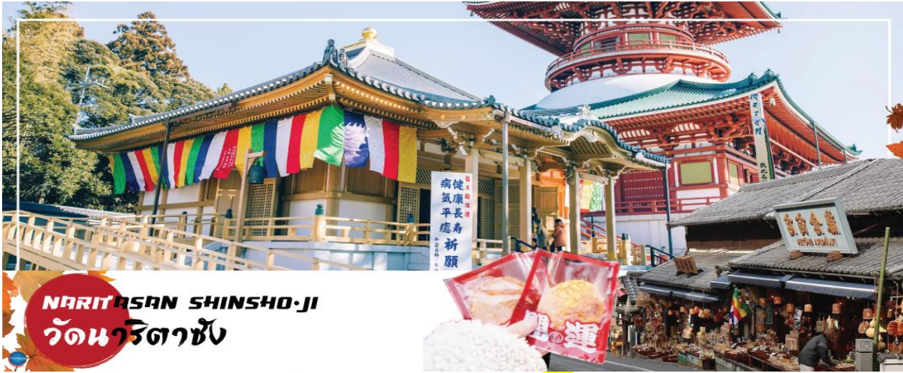
NARITASAN SHINSHO-JI วัดนาริตะชิน

วันที่สี่ เมืองนาริตะ – วัดนาริตะชิน – ถนนปลาไหล โอโมเตะซังโตะ – ย่านโอไดบะ – ห้างไดเวอร์ซิตี – ท่าอากาศยานนานาชาตินาริตะ