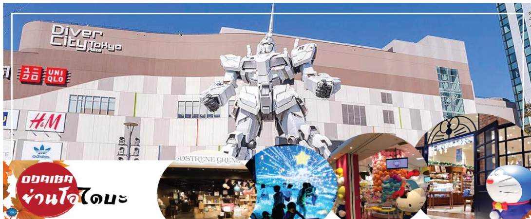
ออดิเชน ย่านโอไดบะ

นำท่านเดินทางสู่ ย่านโอไดบะ (Odaiba) (ใช้เวลาเดินทางโดยประมาณ 1.20 ชั่วโมง) เมืองคือเกาะที่สร้างขึ้นไว้เป็นแหล่งช้อปปิ้ง และแหล่งบันเทิงต่างๆ ในอ่าวโตเกียว ได้รับการปรับปรุงให้มีชื่อเสียงและเป็นที่ยอมรับในช่วงหลังของปี 1990 นอกจากมีสถาปัตยกรรมที่สวยงามตั้งอยู่มากมายแล้ว แต่ก็ยังคงความเป็นธรรมชาติไว้ด้วยความอุดมสมบูรณ์ของพื้นที่สีเขียว ไดเวอร์ซิตี โตเกียว พลาซ่า (Diver City Tokyo Plaza) เป็นห้างดังอีกห้างหนึ่ง ที่อยู่บนเกาะ โอไดบะ จุดเด่นของห้างนี้ก็คือหุ่นยนต์กันดั้ม ขนาดเท่าของจริง ซึ่งมีขนาดใหญ่มาก ในบริเวณห้าง อิสระช้อปปิ้งตามอัธยาศัย