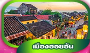
เมืองฮอยอัน