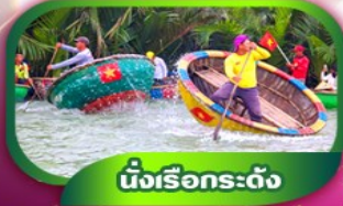
นั่งเรือกระด้าง