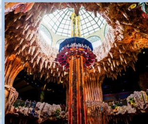
สวนสนุก Fantasy Park