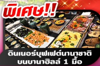
พิเศษ!! ดินเนอร์บุฟเฟต์นานาชาติ บนบานาฮิลล์ 1 มื้อ