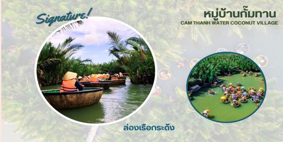
ล่องเรือกระด้ง

ให้ท่านได้สนุกสนานและเพลิดเพลินกับการ “นั่งเรือกระด้ง” (นั่งได้ล่องละ 1-2 ท่าน) ในอดีตเรือกระด้งใช้สำหรับขนของระหว่าง เรือลำใหญ่ ลักษณะจะเป็นตะกร้าไม้ไผ่ สานครึ่งวงกลม ทาด้วยน้ำยาเคลือบกันน้ำ ปัจจุบันนำมาใช้ในการท่องเที่ยว นำท่าน ล่องเรือไปตามสายน้ำและชมธรรมชาติและ วัฒนธรรมท้องถิ่น (ใช้เวลาในการล่องเรือ ประมาณ 15 นาที)