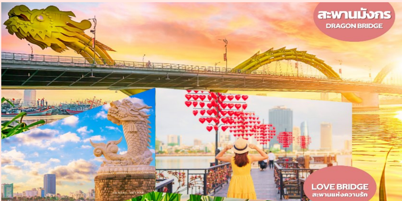
สะพานมังกร DRAGON BRIDGE

ชม สะพานแห่งความรัก (LOVE BRIDGE) ที่คู่รักนิยมพากันมาถ่ายรูป เขียนชื่อคล้องกุญแจบนสะพานแห่งนี้ เป็นอีกจุดที่นิยมสำหรับวัยรุ่นและนักท่องเที่ยว จากนั้นนำท่านชม สะพานมังกร (DRAGON BRIDGE) สะพานมังกรไฟสัญลักษณ์ความสำเร็จแห่งใหม่ของเวียดนาม มีความยาว 666 เมตร ความกว้างเท่าถนน 6 เลนส์ เชื่อมต่อสองฟากฝั่งของแม่น้ำฮานปประเทศเวียดนาม สะพานมังกรถูกสร้างขึ้นเพื่อเป็นแหล่งท่องเที่ยว เป็นสัญลักษณ์ของการฟื้นคืนประเทศ ฟื้นฟูเศรษฐกิจของประเทศโดยได้เปิดใช้งานตั้งแต่ปี 2013 ด้วยสถาปัตยกรรมที่บวกกับเทคโนโลยีสมัยใหม่ที่ได้รับแรงบันดาลใจจากตำนานของเวียดนาม