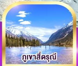
ภูเขาสี่ตรุนี