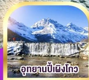
อุทยานปี่ผิงโกว