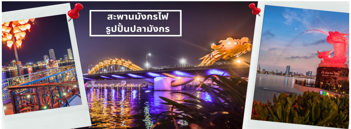
สะพานมังกรไฟ รูปปั้นปลามังกร

จากนั้นนำท่านชม สะพานแห่งความรัก ที่นิยมของหนุ่มสาวคู่รักกันมาซื้อกุญแจใส่คล้องใส่สะพาน จากนั้นนำท่านชม รูปปั้นปลามังกร ที่เป็นสัญลักษณ์ของเมืองดานัง เมืองที่กำลังจะกลายเป็นมังกรในระยะใกล้แห่งเอเชียตะวันออกเฉียงใต้ เชิญท่านเพลิดเพลินกับความอลังการของ สะพานมังกรไฟ ที่มีความยาวถึง 666 เมตร เป็นสะพาน 6 เลนส์ ซึ่งเป็นสะพานที่ตระการตามากที่สุดของเวียดนามในเวลาี่นี้โดยการแสดงนี้จะเริ่มเวลา 21.000น. ของวันเสาร์และอาทิตย์เท่านั้น