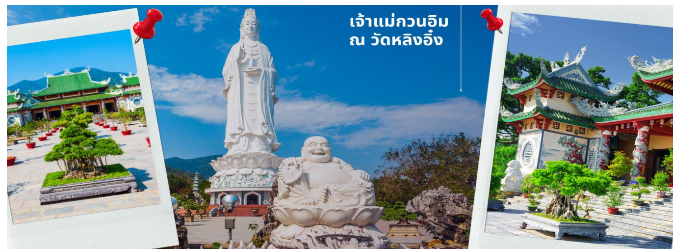
เจ้าแม่กวนอิม ณ วัดหลิงอิ่ง

นำท่านมัศจรรย์องค์ เจ้าแม่กวนอิม ณ วัดหลิงอิ่ง อยู่บนเกาะเซินตรา (Son Tra) ทางเหนือของเมืองดานัง เป็นวัดใหญ่ที่สุดของที่นี่ รูปปั้นปูนขาวของเจ้าแม่กวนอิมยืนหันหลังให้ภูเขา หันหน้าออกสู่ทะเลเพื่อเป็นการปกป้องคุ้มครองชาวประมงที่ออกไปหาปลา เสี่ยงระฆังวัดที่ดีประสานกับเสียงคลื่นนั้นช่วยให้ชาวเรือรู้สึกสงบ