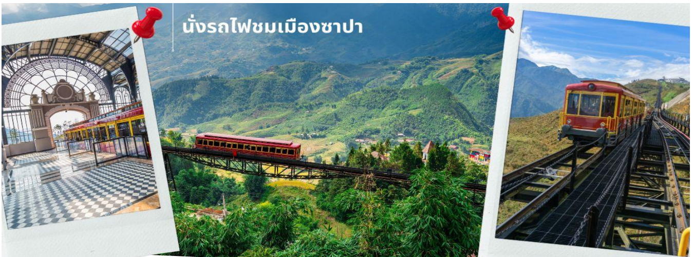
นั่งรถไฟชมเมืองซาปา

นำท่าน นั่งรถไฟชมเมืองซาปา (รวมค่ารถไฟชมเมือง) ท่านจะได้พบกับวิวทิวทัศน์ของเมืองซาปาที่เต็มไปด้วยความสดชื่น และสุดกลืนอายธรรมชาติ และยังตื่นตาไปด้วยวิวภูเขา และนาขั้นบันได ที่มีชื่อเสียงของเมืองซาปาอีกด้วย ความยาวประมาณ 2 กิโลเมตร โดยใช้เวลาประมาณ 20 นาทีเพื่อไปสู่สถานีขึ้นกระเช้าที่จะนำท่านขึ้นสู่ยอดเขาฟานซีปัน