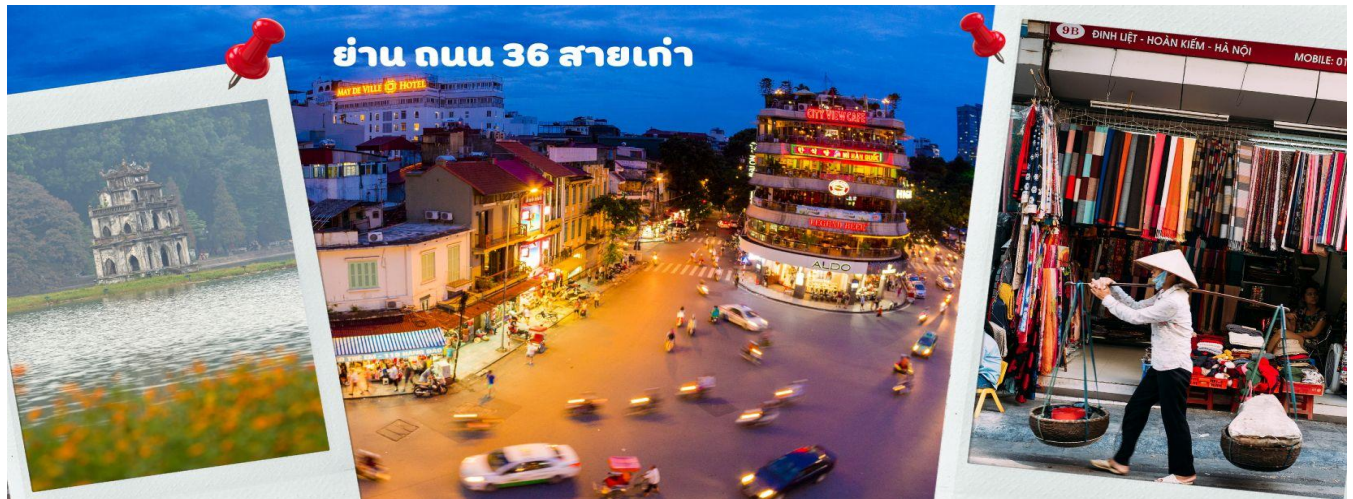
ย่าน ถนน 36 สายเก่า

จากนั้นให้ท่านได้ อิสระช้อปปิ้ง ถนนสาย 36 street แหล่งช้อปปิ้งของฮานอย มีต้นไม้ปกคลุมสองฝั่งถนน สาเหตุที่ชื่อถนน 36 มาจาก 36 อาชีพที่ทำการค้าขายบนถนนแห่งนี้ ตั้งแต่อดีตอย่างงานด้านหัตถกรรมสอดคล้องกับชื่อถนนแต่ปะเส้น ในอดีตตัวอย่าง เครื่องเงิน ผ้าไหม บนถนนแห่งนี้ แต่ปัจจุบันมากกว่า 36 ไปแล้ว ที่นี่จะเป็นแหล่ง Shopping มีสินค้าเกือบทุกชนิด ร้านขายชุดกีฬาทุกแบรนด์เพราะที่นี่เป็นแหล่งผลิตให้หลาย ๆ แบรนด์