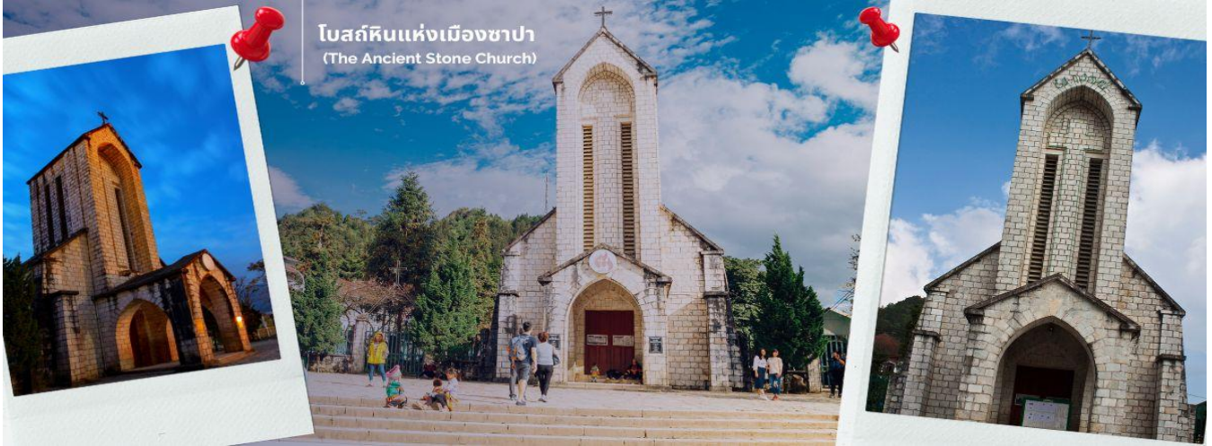
โบสถ์หินแห่งเมืองซาปา (The Ancient Stone Church)

นำท่านช้อปปิ้งที่ ตลาดไนต์เมืองซาปา มีสินค้าให้ท่านเลือกช้อปปิ้งมากมาย ไม่ว่าจะเป็นสินค้าพื้นเมืองของฝาก ขนม กระเป๋า รองเท้า ท่านสามารถช้อปปิ้งได้อย่างจุใจ