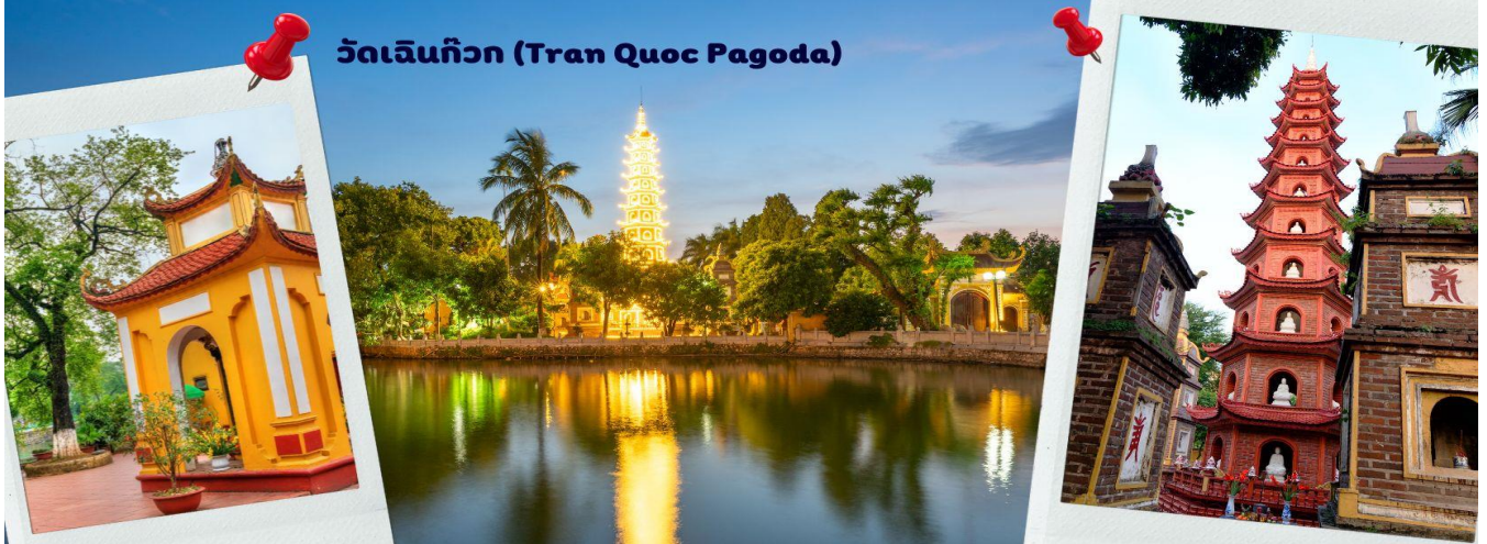
วัดเจดีย์กว (Tran Quoc Pagoda)

ผังเป็นอย่างดี ใช้สีสันทึกลมกลืนในโทนสีเหลือง น้ำตาล ตัดกับสีเขียวของต้นไม้ใหญ่ที่โอบล้อมอยู่ในมุมถ่ายภาพจากอีกฝั่งหนึ่ง จะเห็นสิ่งปลูกสร้างสไตล์จีน และเจดีย์หลายชั้นโดดเด่น มีภาพที่สะท้อนลงสู่ผิวน้ำ เป็นภูมิทัศน์ที่งดงามทั้งยามกลางวันและยามค่ำคืนที่มีการเปิดไฟส่องสว่าง