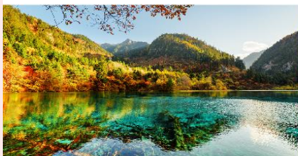
อุทยานแห่งชาติจิวจ้ายโก