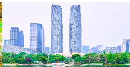
ตึกแฝดเจิงตุ

*ทางบริษัทฯ ขอสงวนสิทธิ์ในการเปลี่ยนแปลงโปรแกรมทัวร์ตามความเหมาะสมขึ้นอยู่กับสถานการณ์หน้างาน โดยคำนึงถึงผลประโยชน์ของลูกค้าเป็นสำคัญ