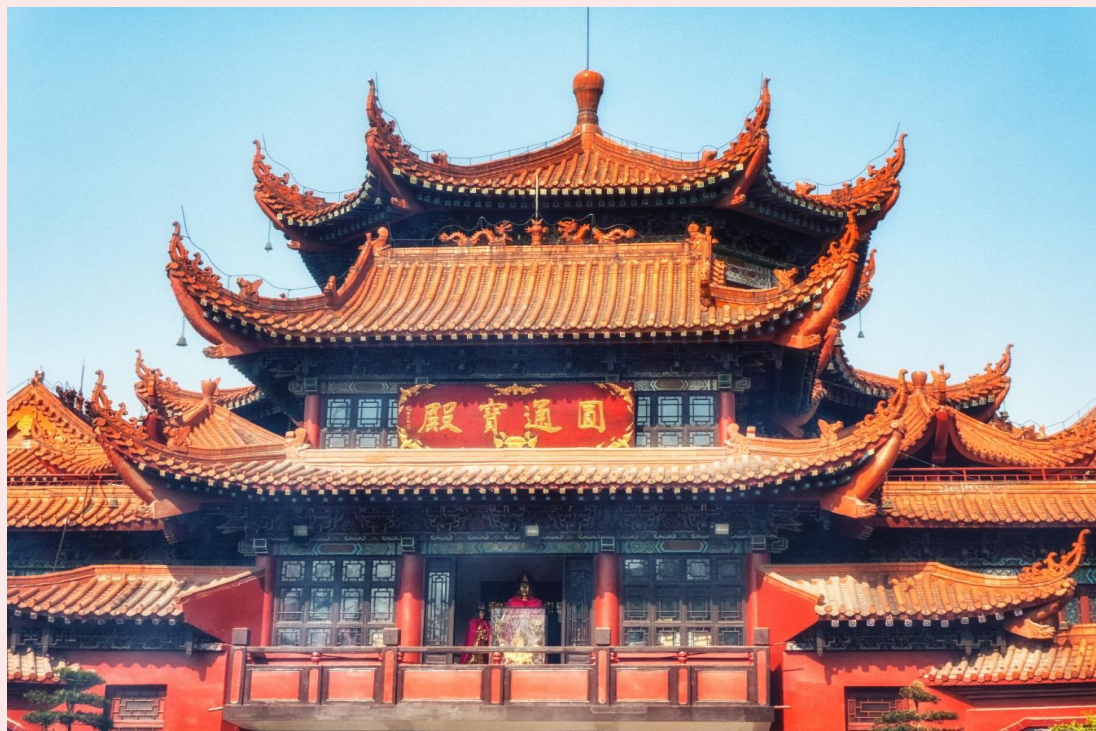
นำท่านเดินทางสู่ ถนนโบราณจินลี่ (Jinli Ancient Street) เป็นถนนของเมืองเฉิงตู มณฑลเสฉวนประเทศจีน ถนนยาวประมาณ 550 เมตร เป็นถนนคนเดินอยู่ติดกับศาลเจ้าสามก๊ก หรือศาลเจ้าขงเบ้ง (จูกัดเหลียง) บุคคลสำคัญในยุคสามก๊ก (ค.ศ. 220-280)