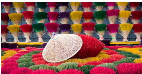
หมู่บ้านรูปหลากสี