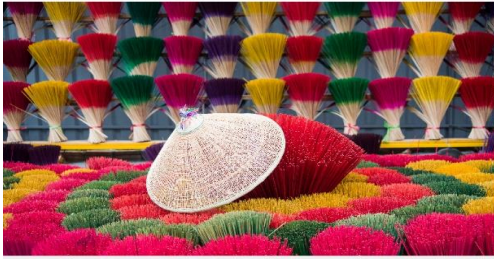
หมู่บ้านรูปหลากสี