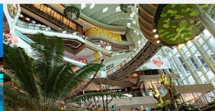
The Ring Mall

*ทางบริษัทฯ ขอสงวนสิทธิ์ในการสลับโปรแกรมทัวร์ตามความเหมาะสมขึ้นอยู่กับสถานการณ์หน้างาน โดยคำนึงถึงผลประโยชน์ของลูกค้าเป็นสำคัญ