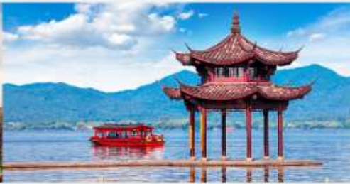
ล่องเรือชมทะเลสาบซีหู