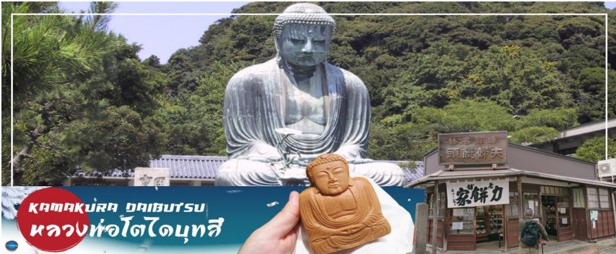
KAMAKURA CHIBUTSU หลวงพ่อโตโคมุทสึ

08.00 น. เดินทางถึง ท่าอากาศยานนานาชาตินาริตะ ประเทศญี่ปุ่น นำท่านผ่านขั้นตอนการตรวจคนเข้าเมืองและศุลกากร เรียบร้อยแล้ว (เวลาที่ญี่ปุ่น เร็วกว่าเมืองไทย 2 ชั่วโมง กรุณาปรับนาฬิกาของท่านเพื่อความสะดวกในการนัดหมายเวลา) ***สำคัญมาก!! ประเทศญี่ปุ่นไม่อนุญาตให้นำอาหารสด จำพวก เนื้อสัตว์ พืช ผัก ผลไม้ เข้าประเทศ หากฝ่าฝืนมีโทษปรับและจับ