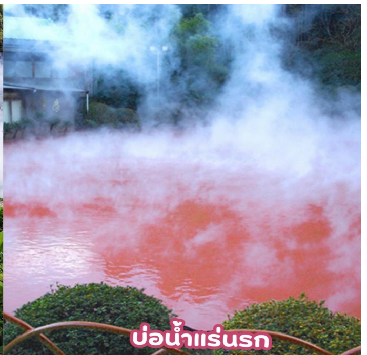
บ่อน้ำแร่นรก

หมู่บ้านยูฟูอิน (YUFUIN FLORAL VILLAGE) เป็นหมู่บ้านเล็กๆที่อยู่ในจังหวัดโออิตะห่างจากเมืองบ่อน้ำร้อนเบปปุประมาณ 10 กิโลเมตร หมู่บ้านแห่งนี้เป็นหมู่บ้านหัตถกรรม และยังเป็นที่ยังคงแบบบ้านต่างๆในประเทศญี่ปุ่นที่มีอายุตั้งแต่ 120-180 ปีมารวมไว้ที่นี่อีกด้วย ที่นี่จึงจัดได้ว่าเป็นพิพิธภัณฑ์ที่มีชีวิตที่สามารถดึงดูดนักท่องเที่ยวให้เดินทางมาเยี่ยมชมได้ตลอดทั้งปี จากนั้นพบความงามของ ทะเลสาบคิริน (Kirin Lake) น้ำทะเลสาบใสเห็นตัวปลาแหวกว่ายในผืนน้ำ บางช่วงมีหมอกบางๆ ลง นับว่าคุ้มค่ากับการมาเห็นความงามนี้ด้วยตาตัวเองสักครั้งหนึ่งอย่างแน่นอน อิสระให้ท่านเดินเล่นและถ่ายรูปตามอัธยาศัย