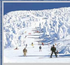
“ZAO SKI RESORT”