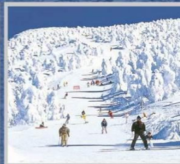
“ZAO SKI RESORT”