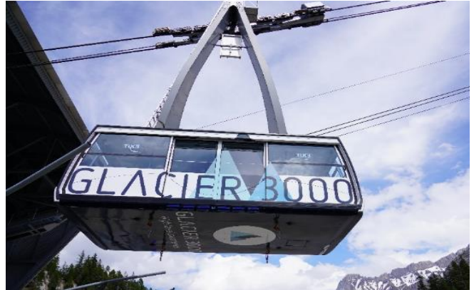
Highlight ! กระเช้าไฟฟ้าขนาดยักษ์ที่จุผู้โดยสารได้ถึง 125 คน

เช้า ๑๐ รับประทานอาหารเช้า ณ โรงแรม (เมื่อที่๙) นำท่านเดินทางสู่ หมู่บ้านโกล เดอ ปียง (Col De Pillon) ประเทศสวิตเซอร์แลนด์ (ระยะทาง 292 กม. / 4.30 ชม.) เป็นที่ตั้งของสถานี จากนั้นนำท่านนั่งกระเช้าลอยฟ้า สู่ ยอดเขากลาเซียร์ 3000 (Glacier 3000) มีความสูงเกือบ 3,000 เมตรเหนือระดับน้ำทะเล ชมทิวทัศน์อันงดงามของท้องฟ้าและเทือกเขามากมายแบบพาโนรามา และให้ท่านท้าทายความสูงเดินบนสะพาน "The Peak Walk by Tissot" สะพานแขวนที่มีความยาว 107 เมตร ข้ามหน้าผาที่ระดับความสูง 3,000 เมตร ทำให้เป็นสะพานแขวนที่สูงที่สุดในโลก อีสระให้ท่านสนุกสนานกับกิจกรรมตามอัธยาศัย (ราคาทัวร์รวม Peak walk and View point / Glacier Walk / Ice Express (chairlift) / Fun Park กรุณาเช็คเครื่องเล่นต่างๆ กับหัวหน้าทัวร์อีกครั้ง)