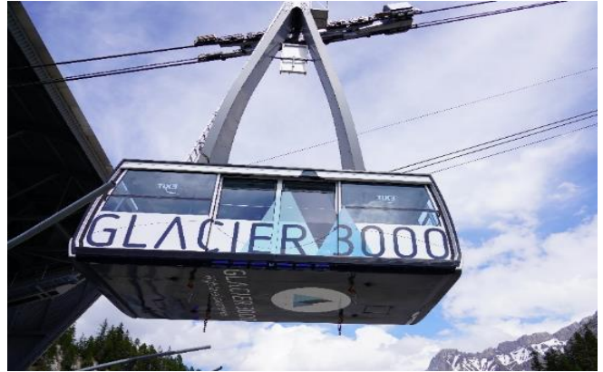
Highlight ! กระเช้าไฟฟ้านขนาดยักษ์ที่จุผู้โดยสารได้ถึง 125 คน

เช้า ๑๐ รับประทานอาหารเช้า ณ โรงแรม (เมื่อที่๙) นำท่านเดินทางสู่ หมู่บ้านโกล เดอ ปียง (Col De Pillon) ประเทศสวิตเซอร์แลนด์ (ระยะทาง 292 กม. / 4.30 ชม.) เป็นที่ตั้งของสถานี จากนั้นนำท่านนั่งกระเช้าลอยฟ้า สู่ ยอดเขากลาเซียร์ 3000 (Glacier 3000) มีความสูงเกือบ 3,000 เมตรเหนือระดับน้ำทะเล ชมทิวทัศน์อันงดงามของท้องฟ้าและเทือกเขามากมายแบบพาโนรามา และให้ท่านท้าทายความสูงเดินบนสะพาน "The Peak Walk by Tissot" สะพานแขวนที่มีความยาว 107 เมตร ข้ามหน้าผาที่ระดับความสูง 3,000 เมตร ทำให้เป็นสะพานแขวนที่สูงที่สุดในโลก อีสระให้ท่านสนุกสนานกับกิจกรรมตามอัธยาศัย (ราคาทัวร์รวม Peak walk and View point / Glacier Walk / Ice Express (chairlift) / Fun Park กรุณาเช็คเครื่องเล่นต่างๆ กับหัวหน้าทัวร์อีกครั้ง)