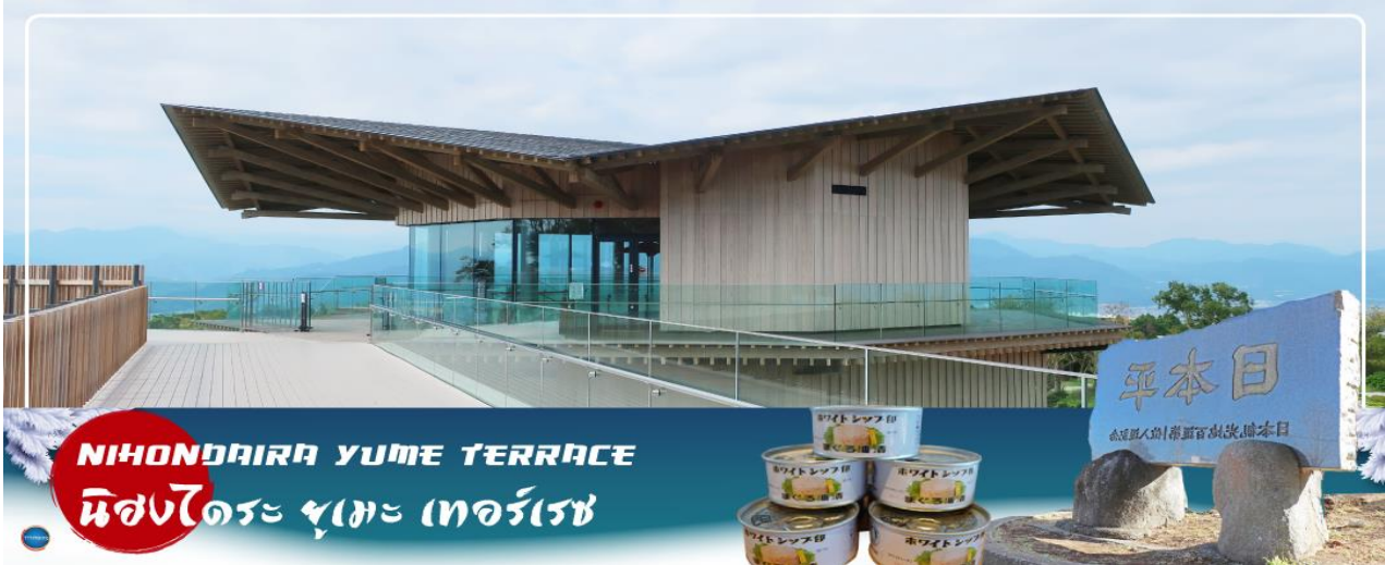
NIHONDAIRA YUME TERRACE นินงะไดระ ยูเมะ เทอร์เรซ

วันที่สี่ เมืองนาโกย่า – จังหวัดชิซุโอกะ – นินงะไดระ ยูเมะ เทอร์เรซ – น้ำตกชิราอิโตะ – เมืองยามานาชิ – หมู่บ้านโอชิโนะสั๊กไก – ออนเซ็น + ชาบูยักษ์