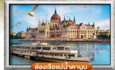
สองเรือแม่น้ำดานูบ

พิเศษ!! ลิ้มลองเมนูประจำชาติ ทั้ง 5 ประเทศ!!!