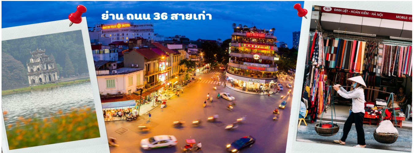
ย่าน ถนน 36 สายเก่า

จากนั้นให้ท่านได้ อิสระช้อปปิ้ง ถนนสาย 36 street แหล่งช้อปปิ้งของसानออย มีต้นไม้ปกคลุมสองฝั่งถนน สาเหตุที่ชื่อถนน 36 มาจาก 36 อาชีพที่ทำการค้าขายบนถนนแห่งนี้ ตั้งแต่อดีตอย่างงานด้านหัตถกรรมสอดคล้องกับชื่อถนนแต่บะเส้น ในอดีตได้อย่าง เครื่องเงิน ผ้าไหม บนถนนแห่งนี้ แต่ปัจจุบันมากกว่า 36 ไปแล้ว ที่นี่จะเป็นแหล่ง Shopping มีสินค้าเกือบทุกชนิด ร้านขายชุดกีฬาทุกแบรนด์เพราะที่นี่เป็นแหล่งผลิตให้หลาย ๆ แบรนด์