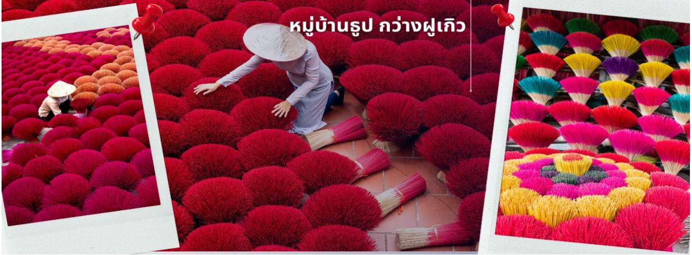
หมู่บ้านรูป กว่างฝูเกิว

ย้อมสี ตากแดด และมัดลักษณะคล้ายพุ่มไม้ หรือ ดอกไม้ เอกลักษณะนี้ถูกพัฒนาและต่อยอด จัดแต่งรูปให้เป็นคล้ายสวน ดึงดูดนักท่องเที่ยวให้ไปเยี่ยมชม เรียกได้ว่า เป็นแลนด์มาร์คใหม่ของนักท่องเที่ยวเลยทีเดียว สลับซับซ้อนราวกับภาพสามมิติ