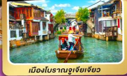
เมืองโบราณซูโจวเจียว