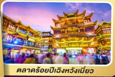
ตลาดร้อยปีเฉิงหวงเมี่ยว

สนุกสนานไปกับเครื่องเล่น Shanghai Disneyland เต็มวัน