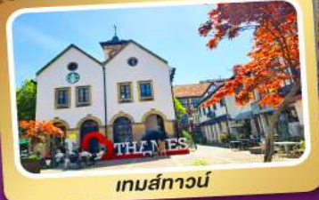
เทมส์ทาวน์